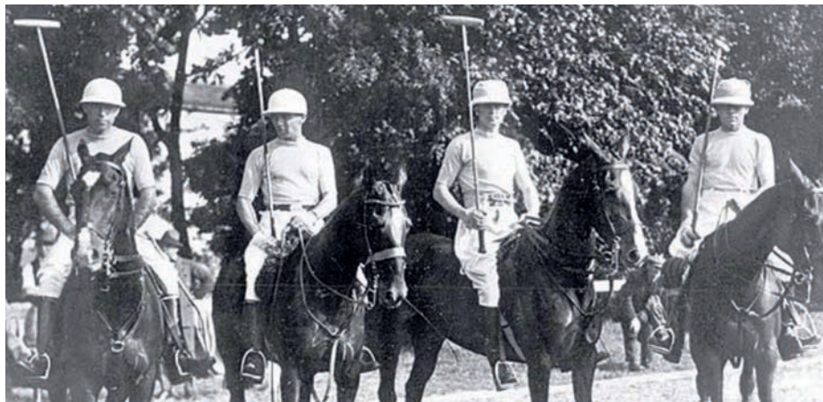
Ready to play! Hästpolo var en av många sporter med brittisk anknytning.