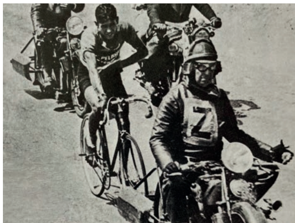
Exempel på pacning från en tävling 1937.