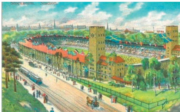
Ett nybyggt Olympiastadion är Facebook-gruppens vinjettbild.

alla möjligheter att odla det egna olympiska intresset och – inte minst – dela med sig egna kunskaper och tankar om det olympiska.