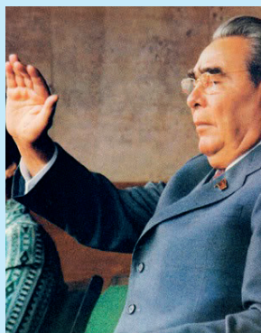
Leonid Breznev på invigningen.

■ Kriget fick långtgående politiska konsekvenser. För OS innebar det att 65 inbjudna nationer inte kom till spelen i Moskva 1980. Fyra år senare svarade 14 länder med att bojkotta tävlingarna i Los Angeles.