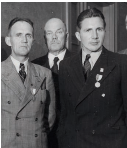
Mora-Nisse olympisk guldmedaljör 1948 i S:t Moritz. I bakgrunden Sixtus Janson.