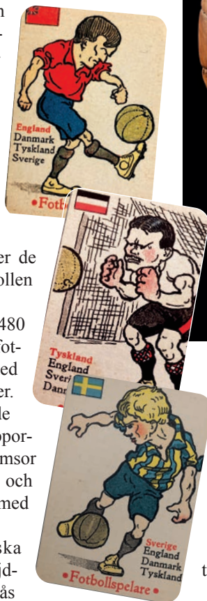
Kortspel från OS 1912.