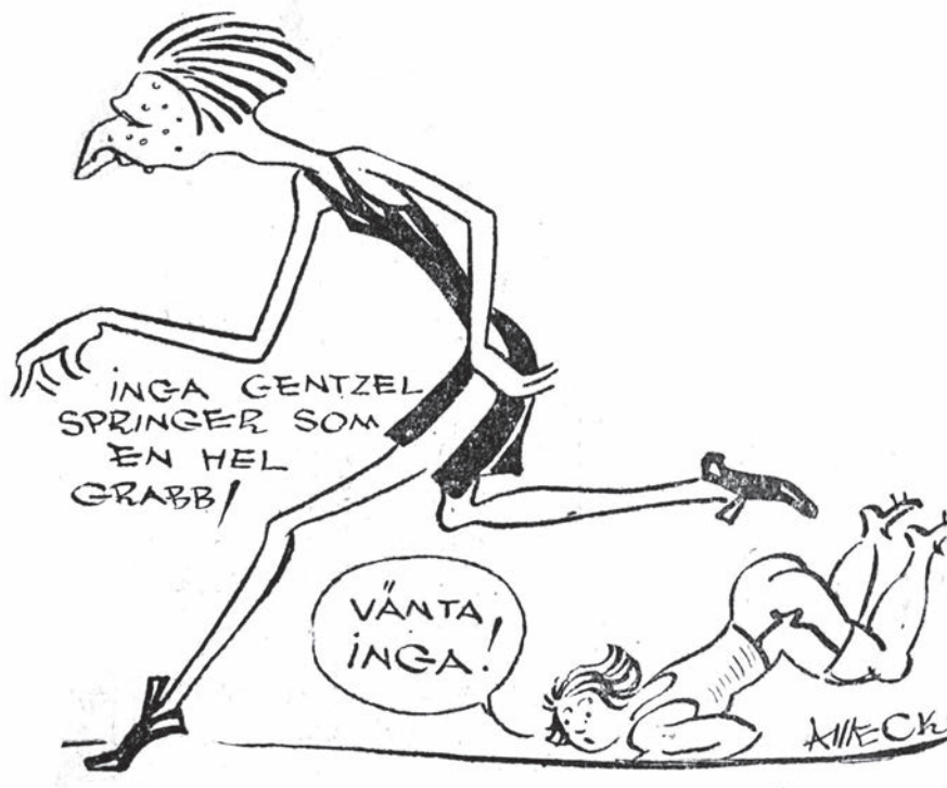
Ingas imponerande löpsteg gav upphov till många karikatyrer.

Blir det våra idrott-girls eller Pojkar som ta poäng i A-dam? — (Om flickorna få resa.)