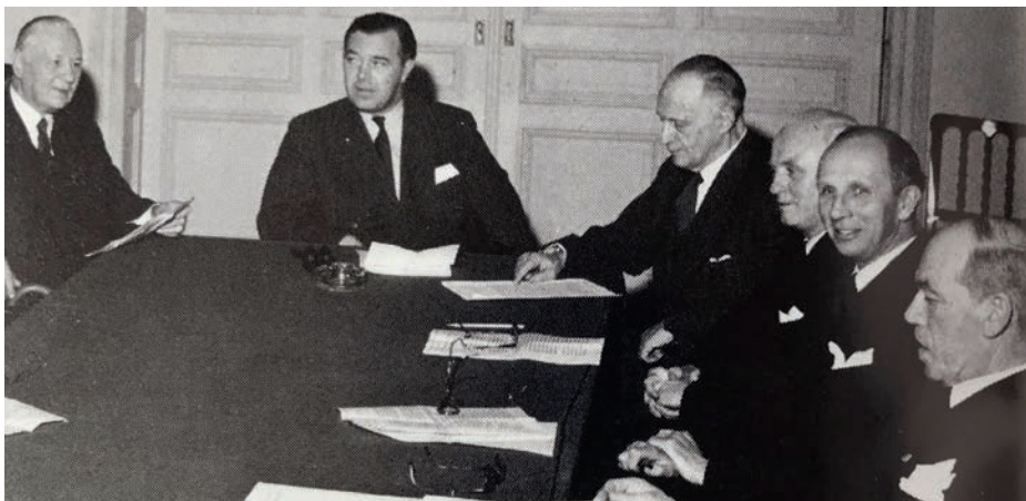
Riksidrottsförbundet vid ett möte 1949. I mitten ordförande Prins Bertil, flankerad av från vänster: Sigrifrid Edström, Einar Råberg, Gustav Frohm, Gustaf Dyrssen och Sixtus Janson, längst till höger.

finns 4 000 fotoplåtar och ett 1 000-tal skioptikonbilder. Är svensk idrott medveten om denna guldgruva? Hur det är med smalfilmerna är väl ovisst.