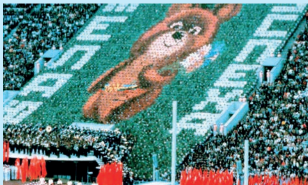
Vid invigningen i Moskva skapade en välregisserad läktarsektion olika bilder, här björnen Misha.