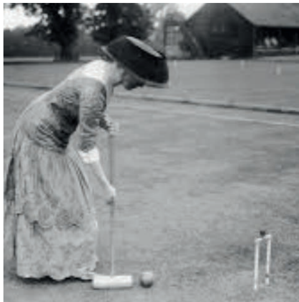
I krocket tilläts även kvinnor att vara med.