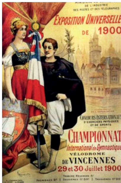
Affisch till tävlingarna i gymnastik. Här märks inte att det handlar om OS.

”Olympismen måste åtnjuta en mer självständig ställning, och inte någon mer gång – som i Paris – reduceras till rollen