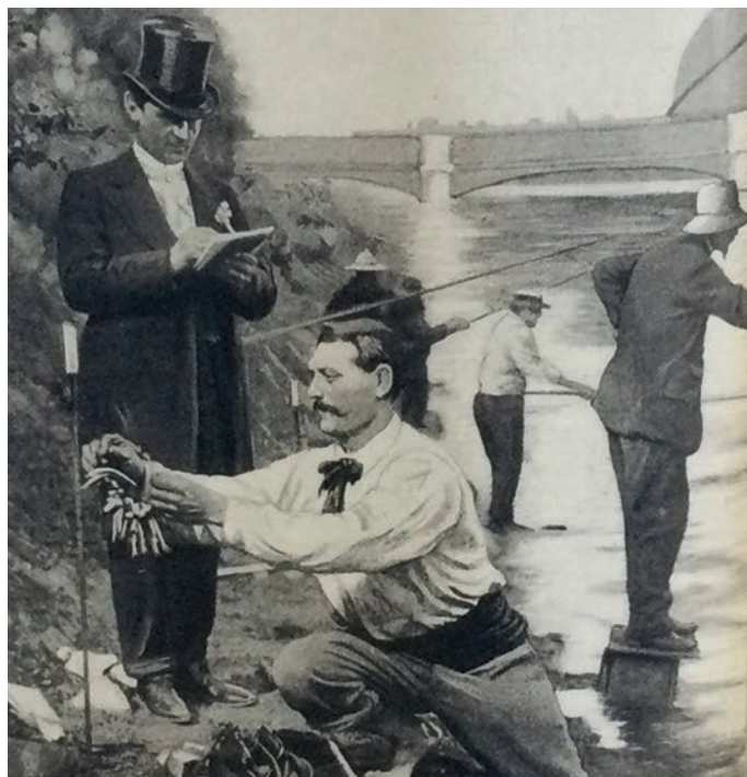
Metarna från hemmanationen satsade på mängd, amerikanerna på att fånga den största firren.