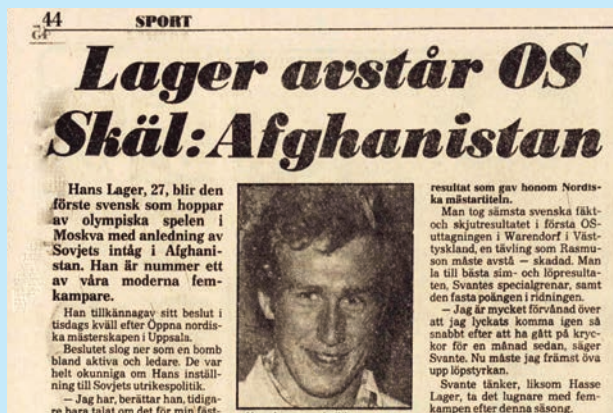
Dagens Nyheter 12 juni 1980.