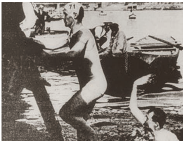
Upp, ned och under, en tävling som gjord för "Mästarnas mästare".

EN TÄVLING som borde passa i tv-programmet "Mästarnas mästare". Det började med att deltagarna fick klättra upp på en fem meter hög påle. Därefter glida ner i vattnet igen. Efter 100 meters simning väntade första hindret: ett antal roddbåtar, som skulle bordas och springas över. Ner i vattnet igen, och nya båtar i vägen. Nu skulle dessa passeras