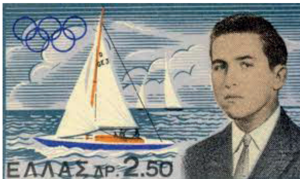
Kronprins Konstantin blev frimärke efter sitt guld i OS 1960.

FOKUS I FÖREDRAGET kommer att vara deltagare från europeiska furstehus och deras olympiska insatser, men också en del om deras liv i övrigt.