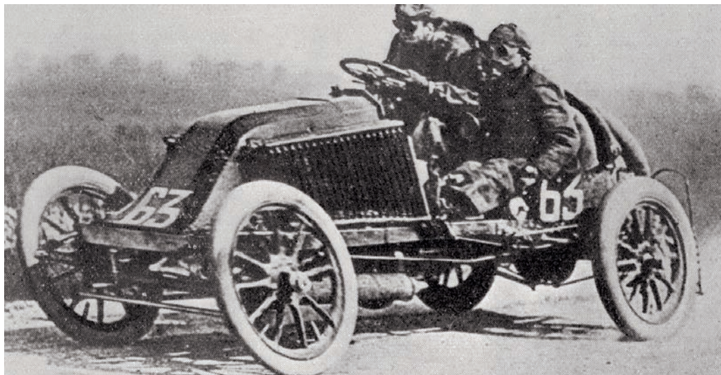
Full gas på väg Paris-Toulouse fram och åter.