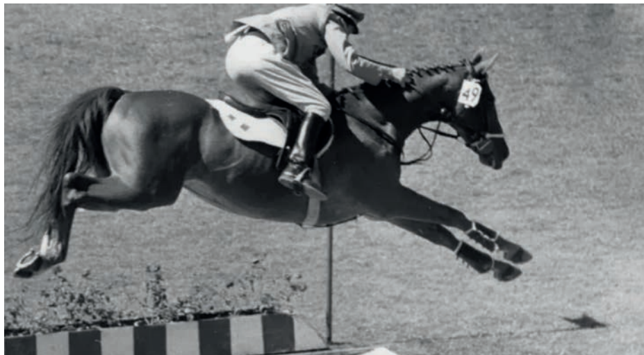
Hästen Extra-Dry levde upp till sitt namn och var torr om hovarna. Vann med längsta språnget.