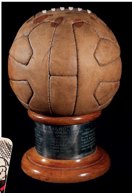
Finalbollen från OS-finalen 1948 efter 3–1 segrer mot Jugoslavien. Fotbollförbundet lät göra en trofé av den med deltagarnas namn på sockeln.

mans med fotograf Edvard Koinberg besökt otaliga bibliotek, museer, idrottsklubbar, förbund och privata samlare i jakt på material.