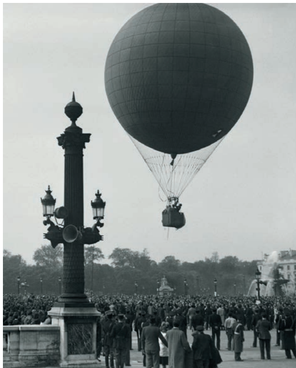
Stort intresse när ballongerna gav sig iväg.