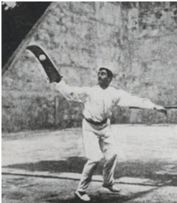
Pelota med racketvarianten cesta.

Olika klasser utkämpades, dels en med så kallad Lyonboll och en annan med den parisiska bollen (ibland kallad bankspel). Ett lag från Lyon vann föga överraskande med Lyonbollen.