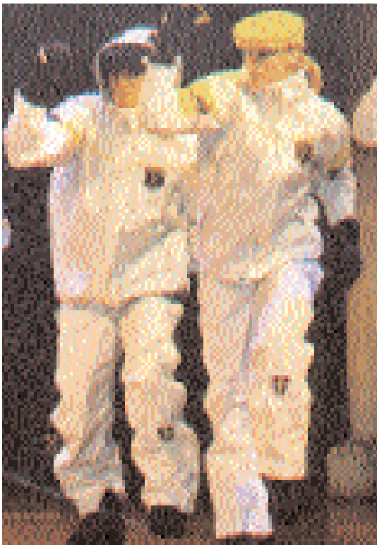
De svenska OS-kläderna till OS i Salt Lake City premiärvisades vid Olympiabalen på Grand Hotel.