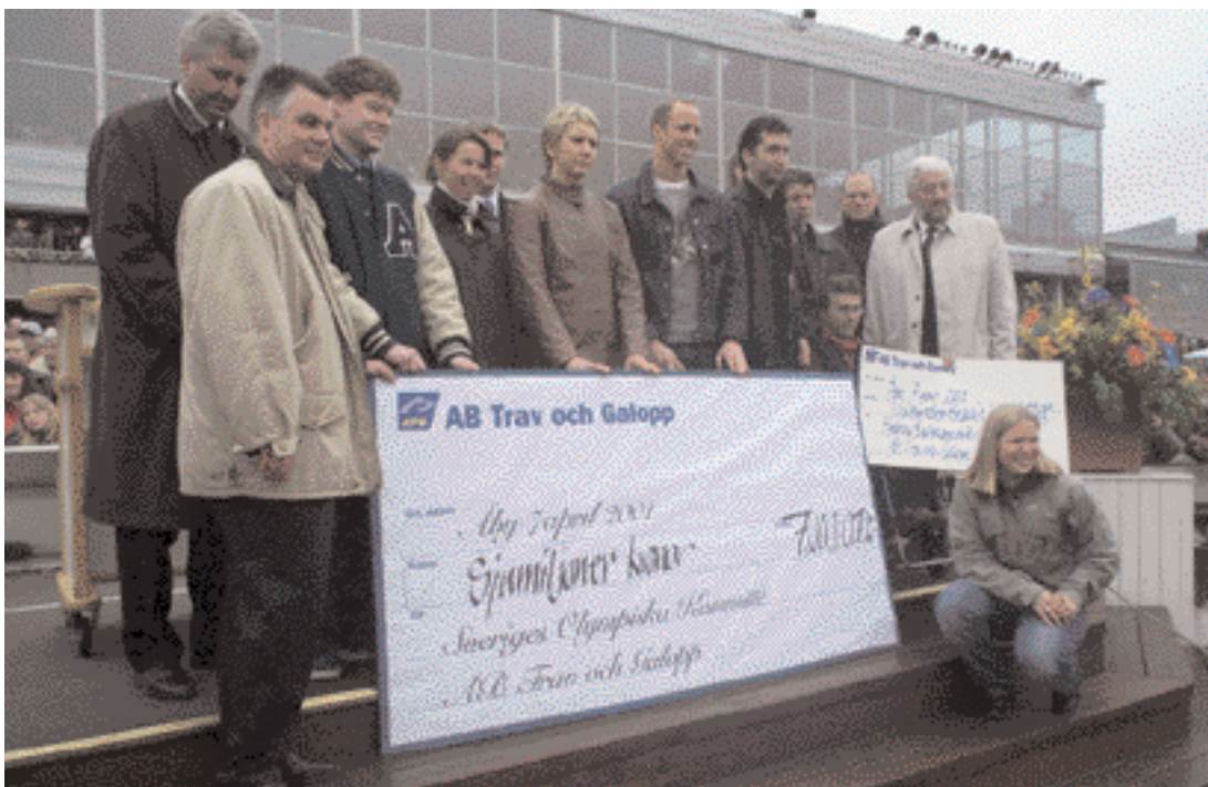
Olympiatravet på Åby samlade som vanligt inte bara världseliten av travhästar utan också, som vanligt, den yppersta OS-eliten av aktiva.