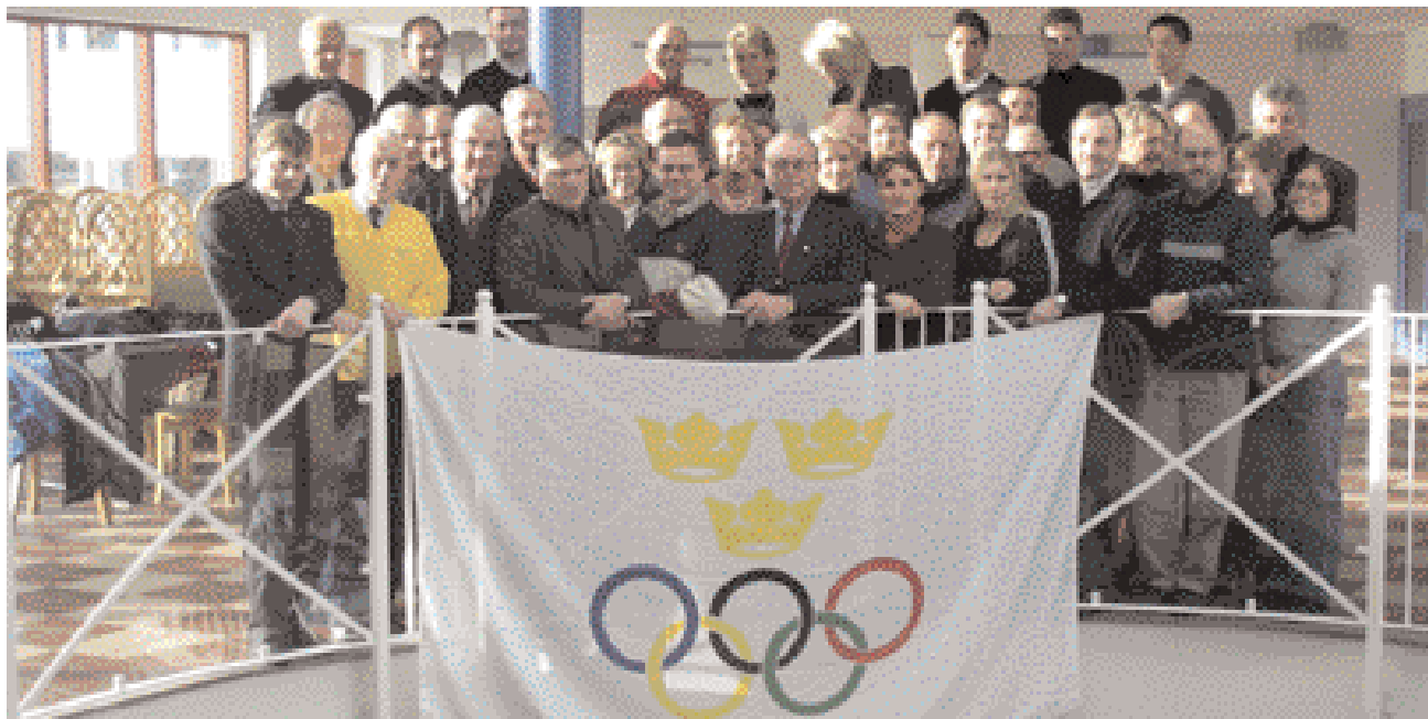
Sveriges Olympiska Akademi arrangerade 2–3 februari en olympisk session på idrottshögskolan i Örebro. Bland gästerna på sessionen fanns bland annat representanter från akademierna i Norge och Danmark.

SOK:s skolprojekt hade också en egen monter vid Skolforum på mässan i Älvsjö den 29–31 oktober och vid Olympic Day Run i Kungsträdgården den 29 augusti.