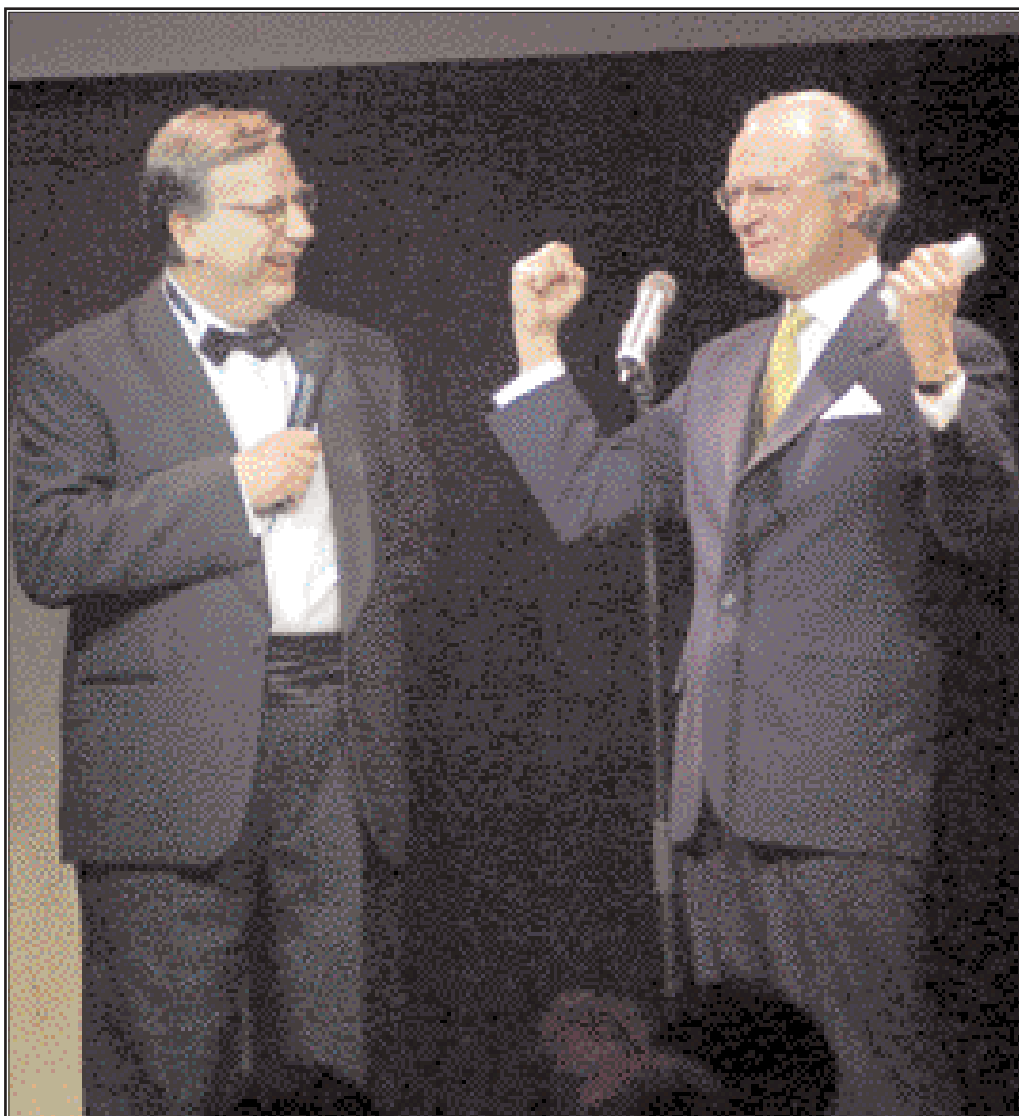
SOK:s traditionella Olympiaball ägde rum den 22 november på Grand Hotel i Stockholm. Ballen var samtidigt en "kick off" inför OS i Salt Lake City. Som vanligt var Kung Carl Gustaf på ett strålande humör och bjöd baldeltagarna på många skratt då han intervjuades från scenen av Sven Melander. Två mycket idrottsintresserade personer som fann varandra.