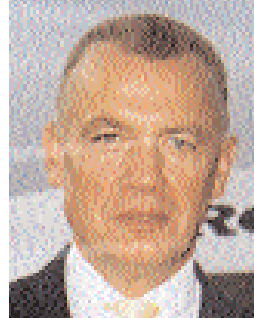
Björn Rosengren vice ordförande