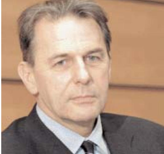
IOK:s nyvalde president Jacques Rogge gästade Stockholm och SOK i samband med Olympiabalen och det olympiska marknadsföringsseminariet den 22 november.