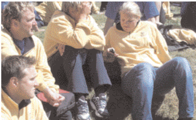
Anja Pärson var en av deltagarna på SOK:s Olympic Camp på Fagerudd utanför Enköping på försommaren.

Aktiva i topp-programmet erbjuds möjlighet att delta i vissa av de utvecklingsträffar som arrangeras för talanggruppen. Under året har det varit aktuellt såväl i mediautbildningen som den samling som behandlar försäkringar, skatter, sponsring med mera.