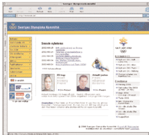
SOK Magasin och SOK:s hemsida svarar för en del av informationsverksamheten.

grupp och som under säsongen bevisat sin kapacitet. OS-uttagningarna började den 29 maj och fortgick till den 20 januari. Redovisning över uttagningarna till Salt Lake City sker i särskild bilaga.