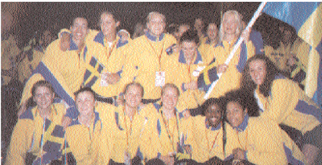
De svenska basketflickorna kom på femte plats i ungdoms-OS i Murcia.