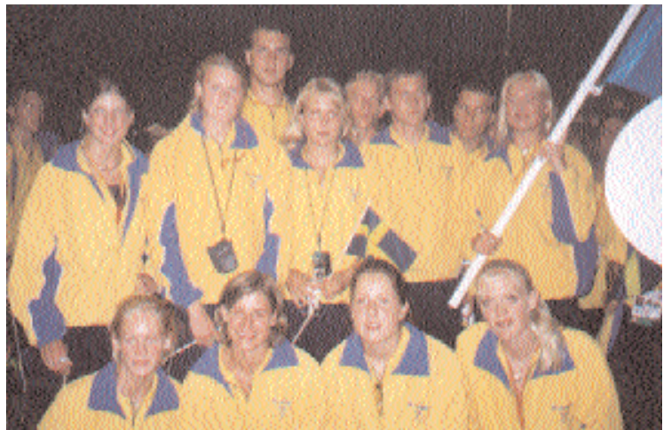
Blivande OS-stjärnor? Ja, friidrottarna kammade hem fem medaljer vid Ungdoms-OS.